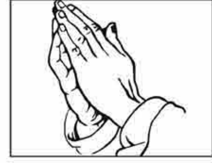
એક સદ્ગુહસ્થ (મનફરા)