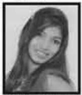
रिषि जयंथी सत्रा (सुवर्ध)